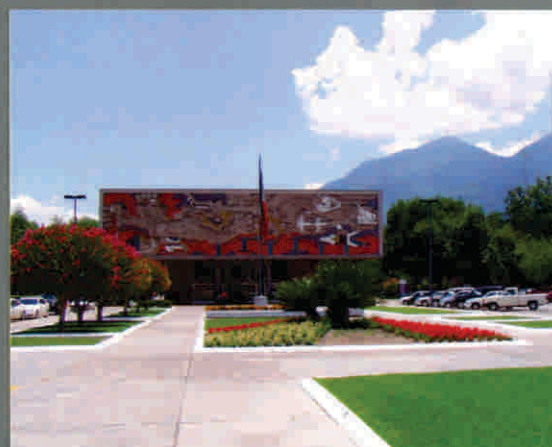
Tecnológico de Monterrey, México

La experiencia y trayectoria de Comfama en Gerencia y Pensamiento Social se encuentra disponible en el sitio web: www.comfama.com/gerenciasocial/ Allí encontrará las publicaciones, el currículum de los docentes y quiénes son los egresados que han participado en los distintos seminarios. Más una completa cronología de los cursos y conferencias nacionales e internacionales que ha realizado la Caja a lo largo de su historia.