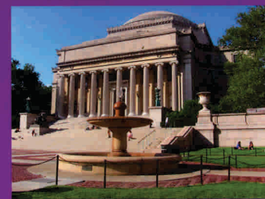
Columbia University, Estados Unidos.