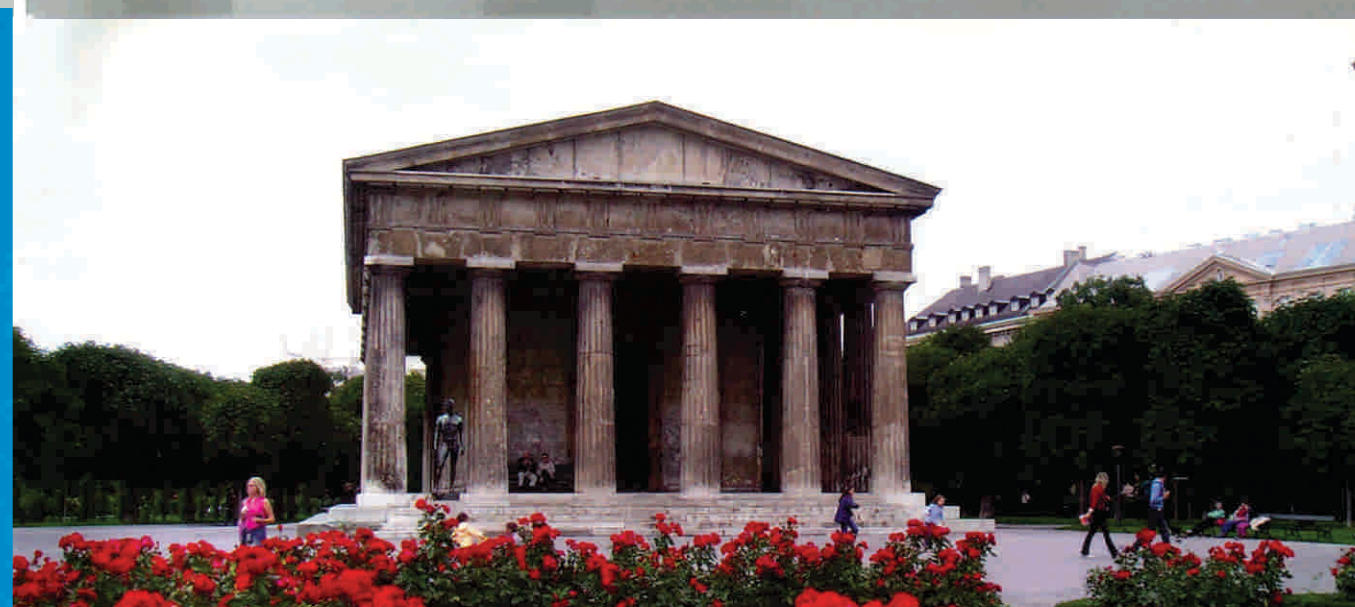
Universidad Complutense de Madrid, España.