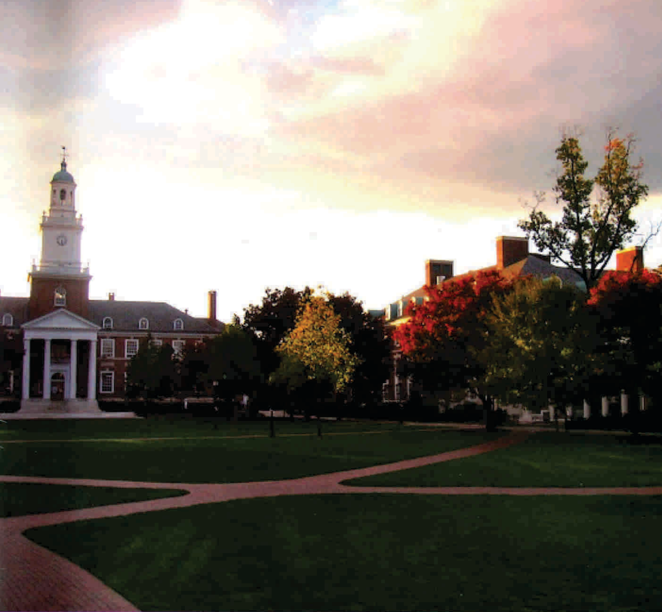
Johns Hopkins University, Estados Unidos