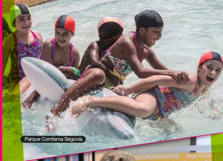
Parque Comfama Segovia.

Un primer trimestre en el que crecimos con las empresas, las familias y las regiones de Antioquia.