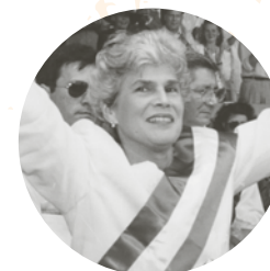
Violeta Barrios Torres o Violeta Chamorro, primera mujer elegida jefa de Estado en Latinoamérica por votación popular. Nicaragua, 1990.

Fuentes: El país de España, BBC mundo, El Espectador , The New York Times .