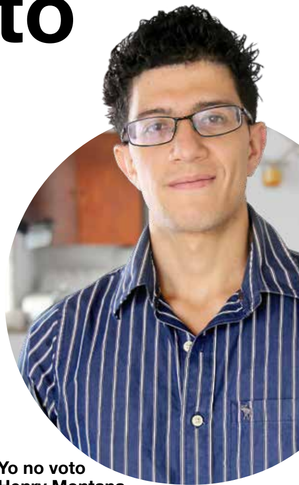
Yo no voto Henry Montana

Más que el voto, es la influencia que puedo ejercer en los demás, especialmente en aquellas personas desinteresadas acerca de temas políticos o electorales. Si les puedo sembrar la curiosidad, ponerlos a pensar un poco, y tal vez invitarlos a que voten, ya es ganancia.