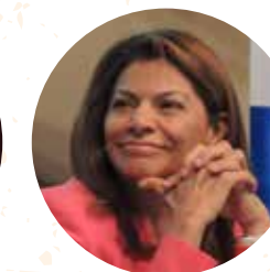
Laura Chinchilla Costa Rica 2010.