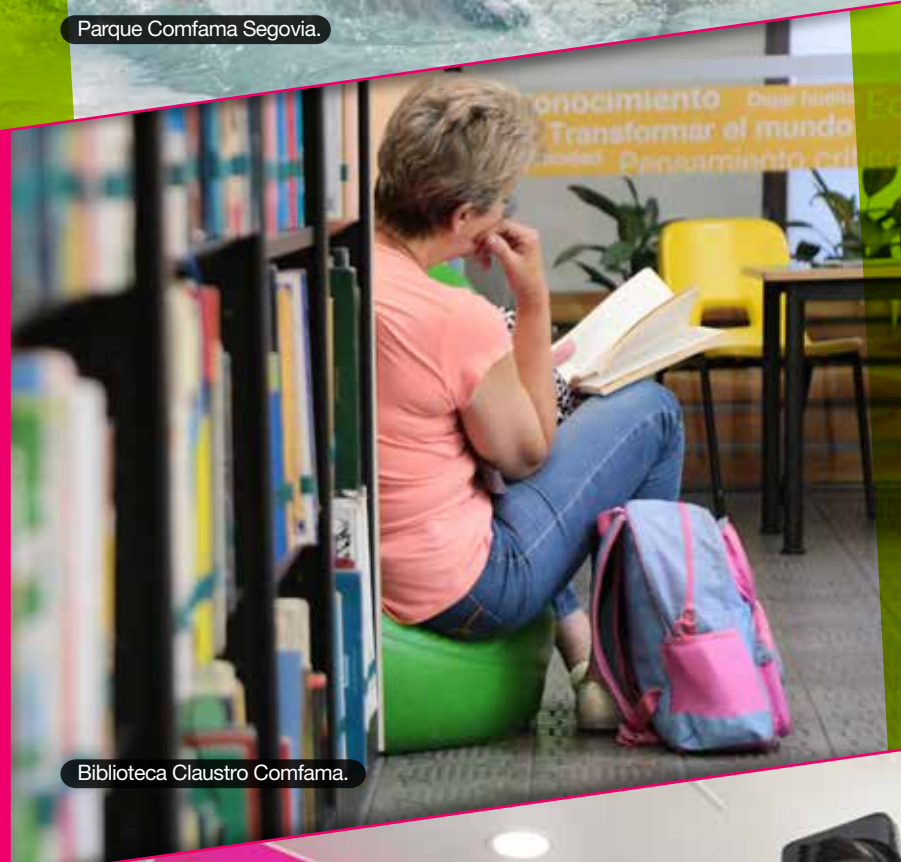
Biblioteca Claustro Comfama.