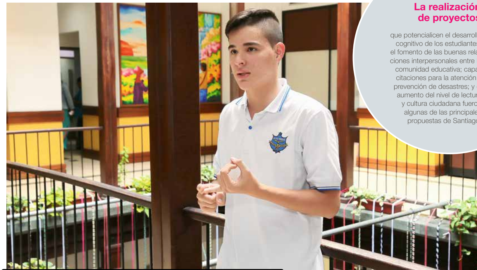
Santiago hace parte del programa El líder sos vos de la Secretaría de Educación de Medellín.

Fuentes: registraduria.gov.co , elespectador.com , eltiempo.com .