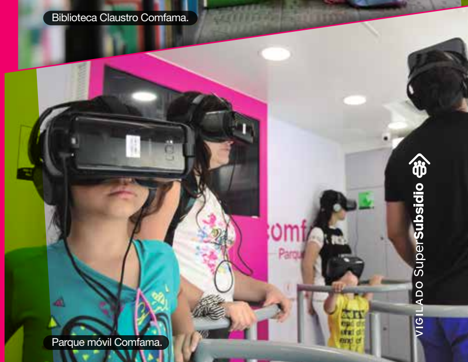
Parque móvil Comfama.