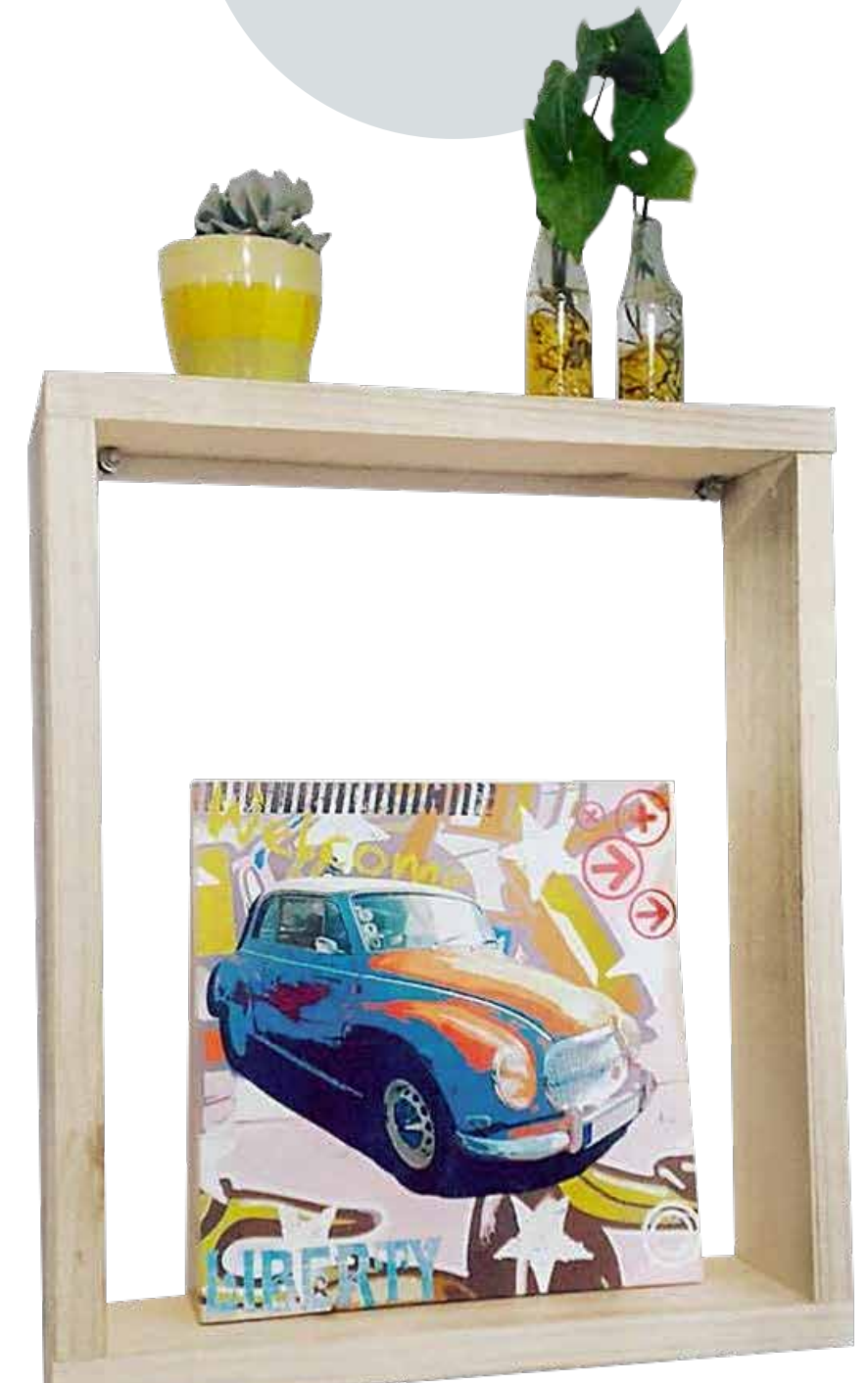
Uno de los obsequios que se comparten los Palacio.