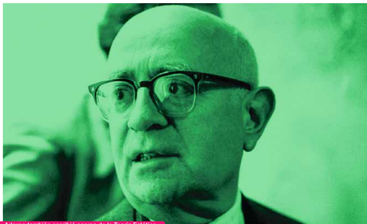
Adorno también escribió acerca de la Teoría Estética.