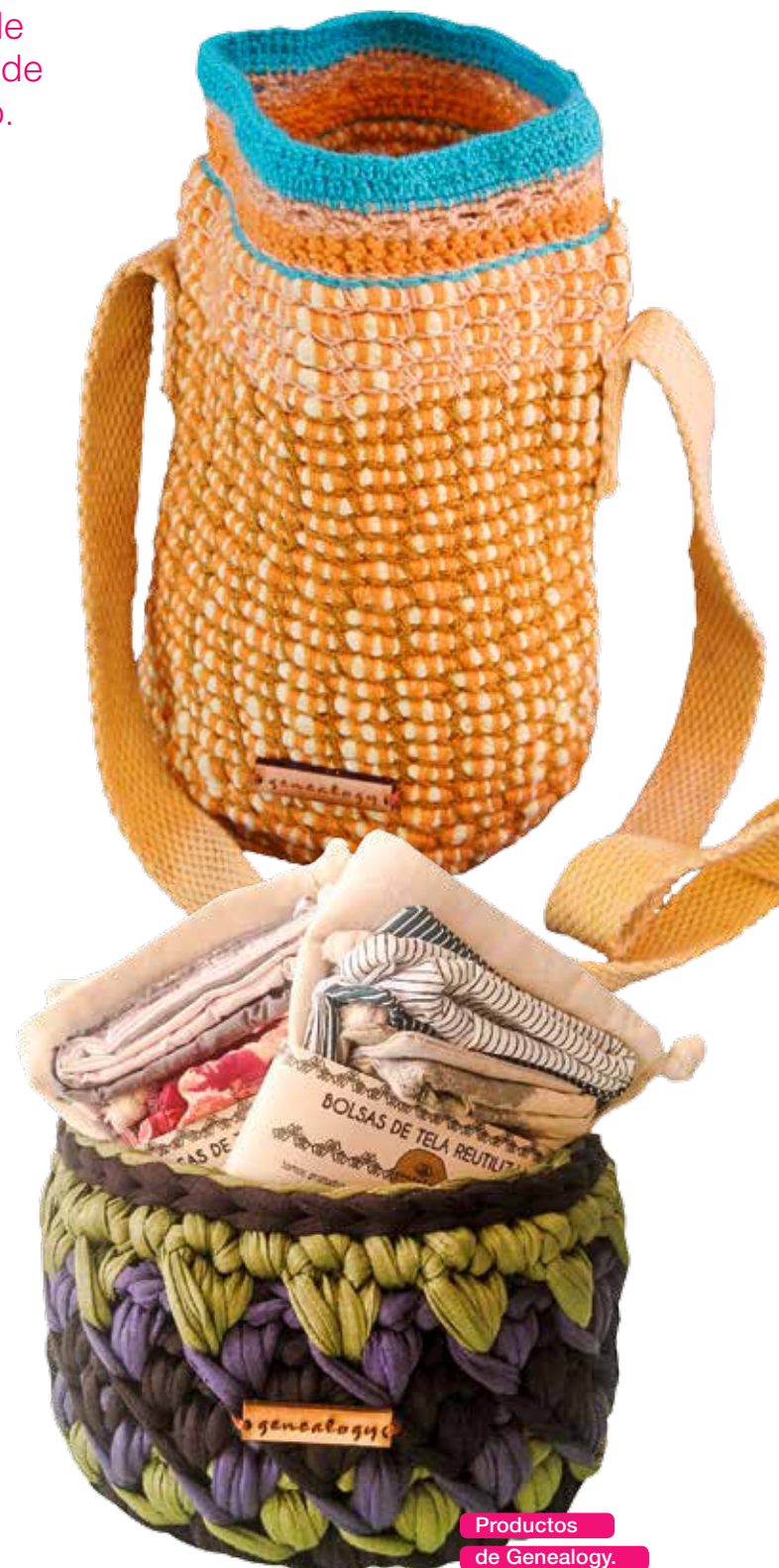
Productos de Genealogy.